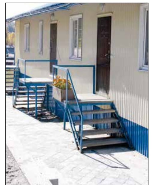
Благоустройство территории нового общежития

решение по ним будет принято совместно с депутатами.