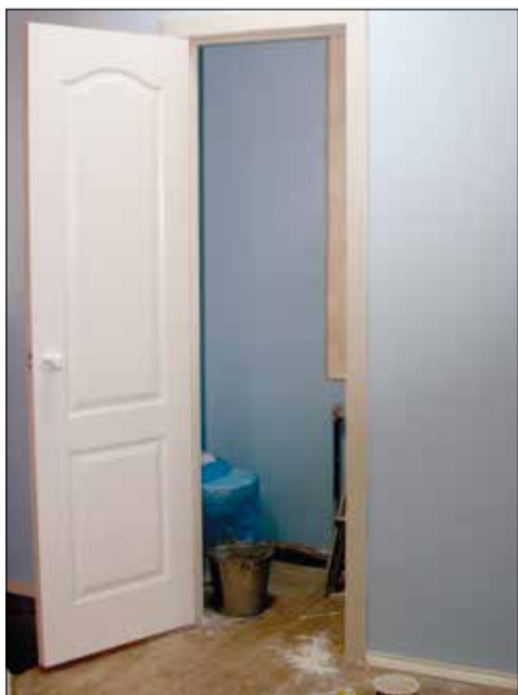
В ДК теперь теплый туалет