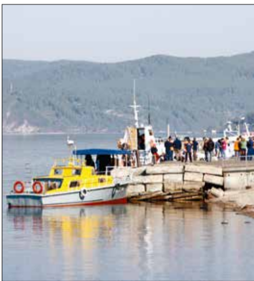
Планируется выделение средств на берегоукрепление

— Генеральный план поселка Вы не считаете проблемой?