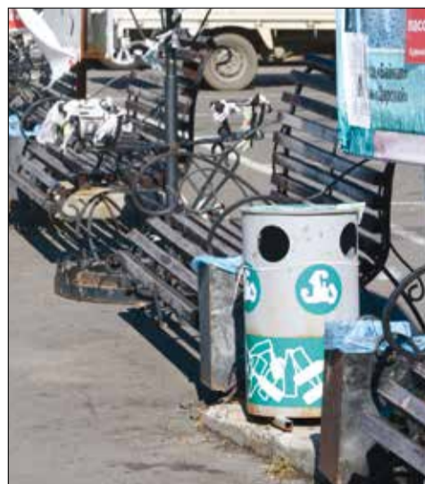
Эко-урны на набережной

Проведено благоустройство территории возле нового дома (общежития) по ул. Октябрьская, 9 «Б». Тротуары, подходы к квартирам выложены плиткой. Обустроена стоянка для автотранспорта жителей.