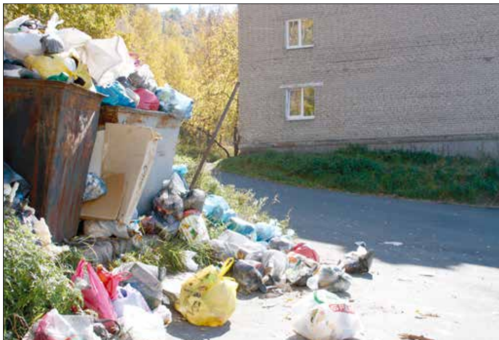
Новая управляющая компания начнет с уборки мусора

— До конца года однозначно — за 5 кубов.