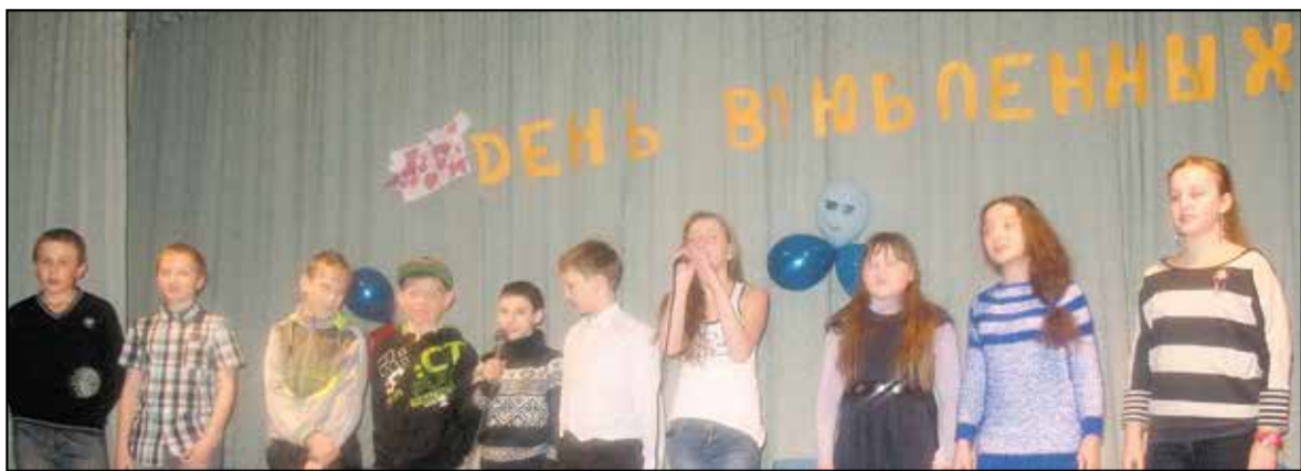
5 класс — с лучшей песней про любовь