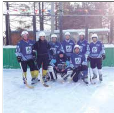
Хоккеисты — к победе!

Наши хоккеисты — большие молодцы, начиная с 5-го января, хоккейная команда Листвянки участвует в кубке Иркутского района и проводит по две игры в неделю. Удача не обходит стороной — у нас 4 победы! На сельских играх мы остановились на групповом этапе, выиграв у команды Максимовщины 4:0. Поздравляю всех!