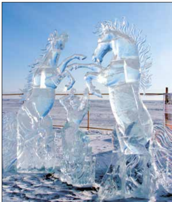
Вместо нашей «Нерпы» — ледяные лошади в Бугульдейке