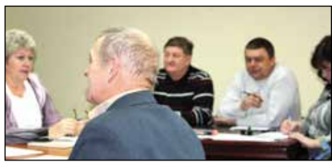
Депутаты в работе

Согласно закону о СМИ, работа в газете строится на основании задания от учредителя, коим является администрация Литвянского МО. Учредитель определяет инфор-