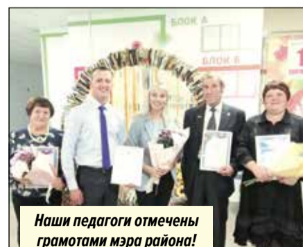
Наши педагоги отмечены грамотами мэра района!

Летние каникулы завершились. Позади много радостных, веселых, ярких моментов, которые надолго останутся в памяти каждого ребенка. Отдых на море, теплые денечки у родных, на природе, встречи с друзьями — одним словом, каждому есть, что вспомнить о лете. И нам тоже.