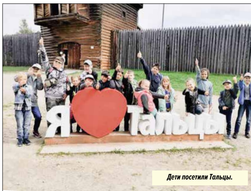
Дети посетили Тальцы.

В этом году летний лагерь на базе школы прошел в августе. Педагоги постарались разнообразить содержание каждого дня, чтобы ребятам было интересно. Тематические игры, творческие задания, конкурсы рисунков, спортивные соревнования, но особенно ребята любят выездные мероприятия, экскурсии. Команды съездили в кинотеатр, побывали в зоопарке, где много хищных животных, отдохнули на природе в музее деревянного